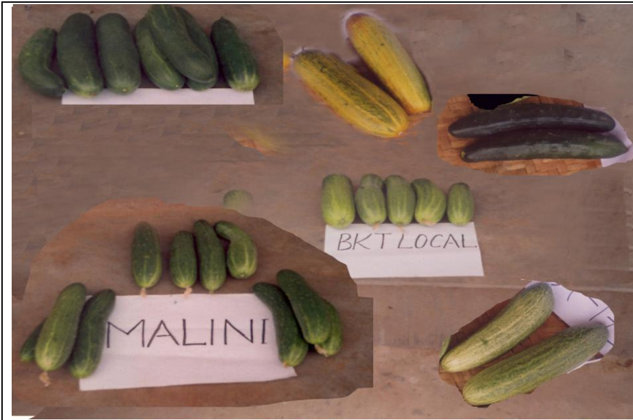
कृषकको खेत/बारीमा परीक्षण गरिएका केही जातहरू