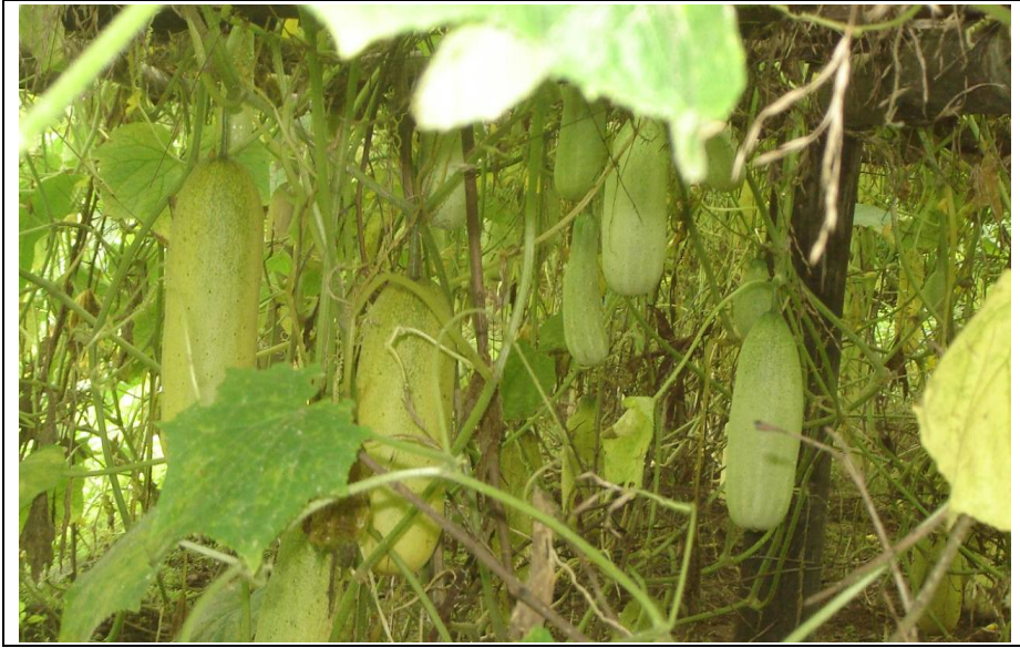
भक्तपुर स्थानीय जातमा वनस्पतिजन्य विषादीको परीक्षण